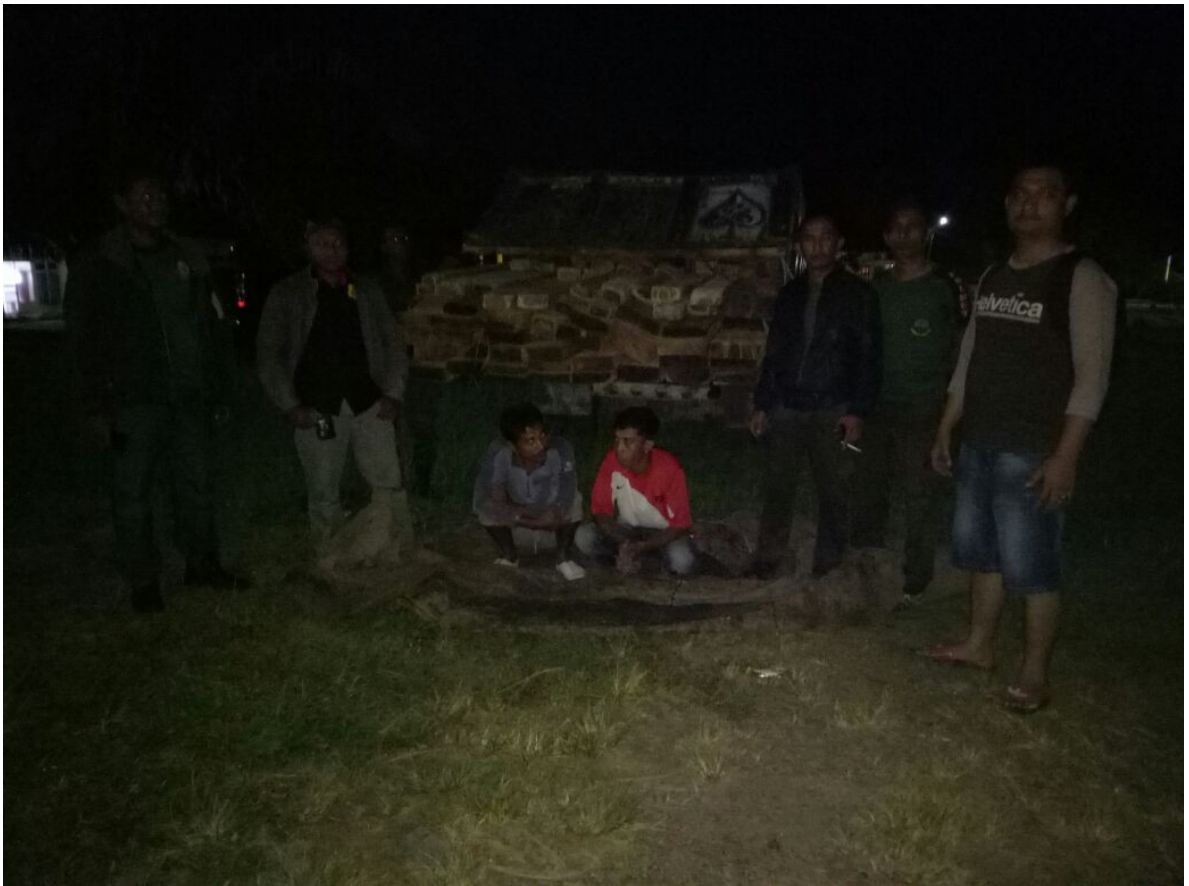
Festgenommene illegale Holzfäller mit beschlagnahmten Holz.