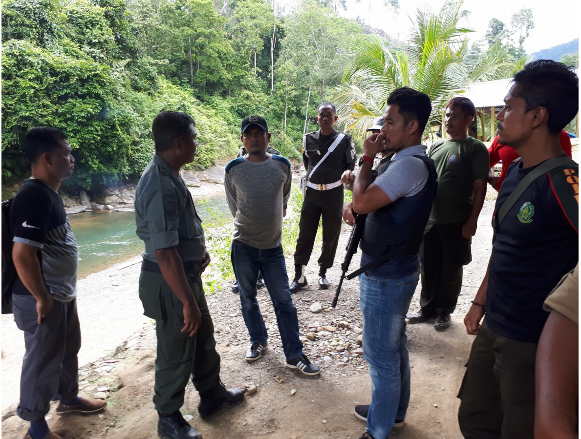
Razzia gegen illegale Holzfäller, zusammen mit der Polizei