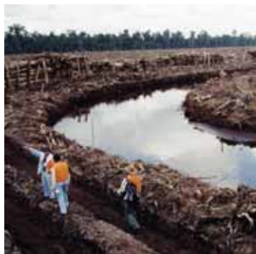
Das Kanalnetz entwässert den ökologisch wertvollen Torfwald

Beide Fabriken beendeten das Geschäft mit einer Reihe von Lieferanten, die nachweislich illegal geschlagenes Holz verkauft hatten und kündigten schärfere Herkunftskontrollen ihres Rohstoffverbrauchs an. „Bei APP war jedoch trotz mehrfacher Nachfrage angeblich niemand verfügbar, der die Kontrolle hätte demonstrieren können. Die einzige erhältliche Information war, dass bisher noch keine EDV bei der Zulieferung eingesetzt wird“, berichtet Jens Wieting. Ein Vertreter von APP habe eingeräumt, dass das Unternehmen derzeit nicht garantieren könne, dass kein Holz aus Schutzgebieten in die Fabrik gelange.