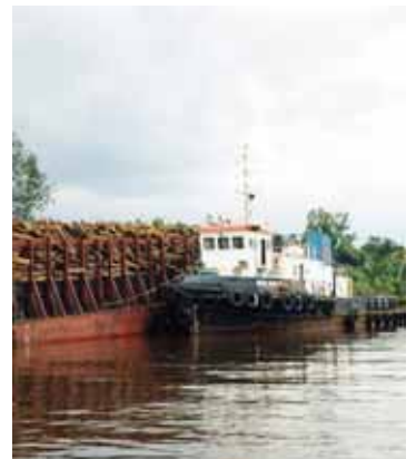
Holztransport für APP aus dem Regenwald auf dem Siak