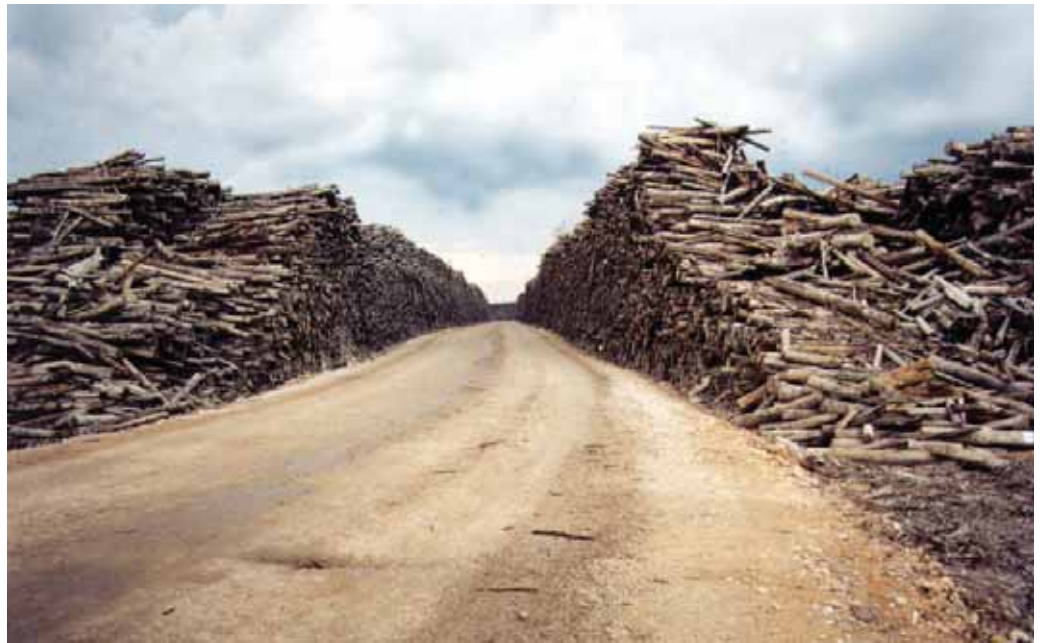
Holz auf dem Fabrikgelände von APRIL.

Die Fläche des Tiefland-regenwaldes auf Sumatra schrumpfte zwischen 1990 und 2002 um 60 Prozent. Hauptverantwortlich sind die Zellstoff-, Palmöl- und Holzindustrie sowie die Regierung, die keine Kontrolle ausübt