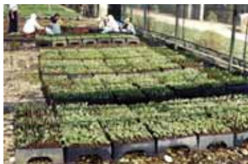
Vermehrung der Eukalyptusbäume durch Stecklinge