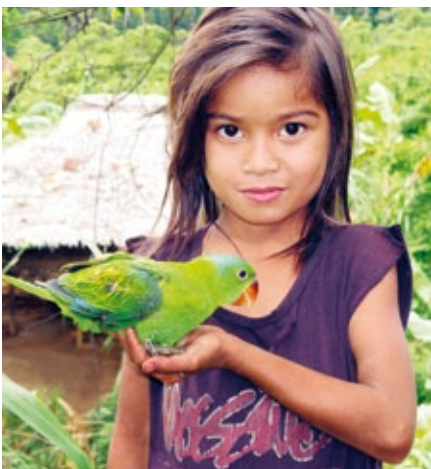
Die Familien leben mit dem Regenwald

Palawan Island gehört zu den artenreichsten Lebensräumen der Philippinen. Um sie zu bewahren, hat die Unesco die Inselgruppe 1990 zum Biosphären-Reservat erklärt. Dennoch treiben Landes- und Provinzregierung den Abbau von Nickel und Chrom massiv voran. Rettet den Regenwald unterstützt das lokale Netzwerk ALDAW seit knapp zwei Jahren bei seiner internationalen Kampagne gegen den Bergbau.