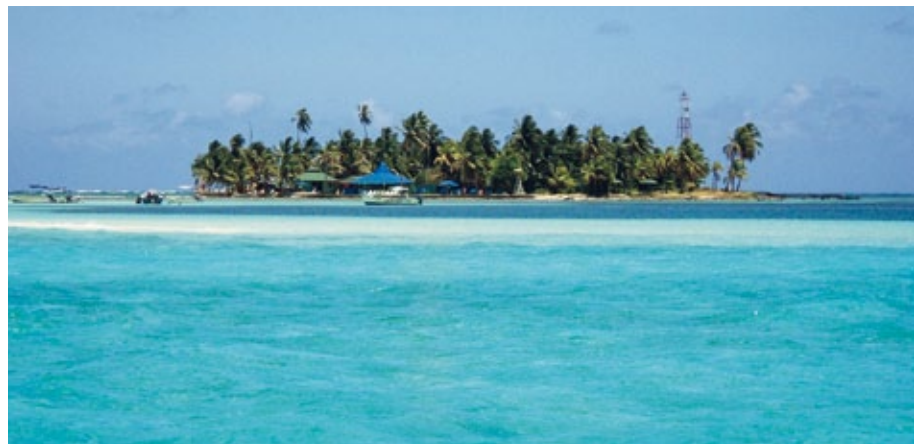
San Andrés: Das karibische Inselparadies bleibt von der Ölindustrie verschont

Auf den nächsten Seiten berichten wir über die Arbeit unserer Partner in den Regenwaldländern.