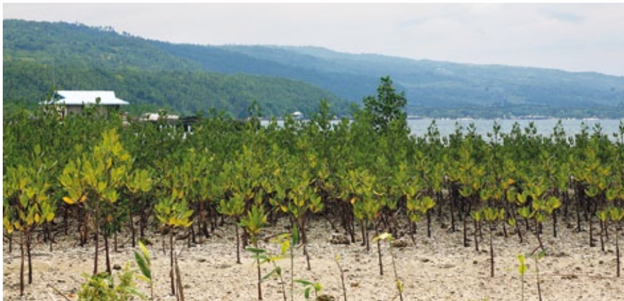
Diese Mangroven schützen die Küste – und ernähren sogar die Fischer

Mangroven sind einzigartige Lebensräume – unverzichtbar für Meeresbewohner und ihre Brutplätze, für Vögel, Insekten und für den Küstenschutz. Auch die Menschen nutzen sie als Nahrungsquelle. Doch auf der kleinen Insel Samal Island im Golf von Davao wurden die Mangroven abgeholzt, um Bauholz und Holzkohle zu gewinnen.