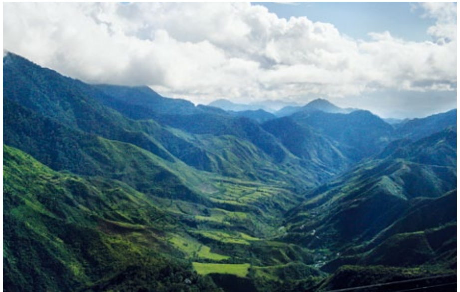
Im Intag leben viele bedrohte Tierarten wie Brillenbären, Fischotter und Puma

Seit 20 Jahren versuchen internationale Mininggesellschaften, die Bodenschätze dieser Region auszubeuten. Oft lassen sie die Bevölkerung durch Paramilitärs einschüchtern. Doch durch ihren Mut, Zusammenhalt und Ausdauer ist es den Menschen immer wieder gelungen, dies zu verhindern – auch mit Unterstützung von Rettet den Regenwald. So konnten die Intag-Bewohner nicht nur ihren Wald schützen, sondern sich dort auch neue Einkommensquellen