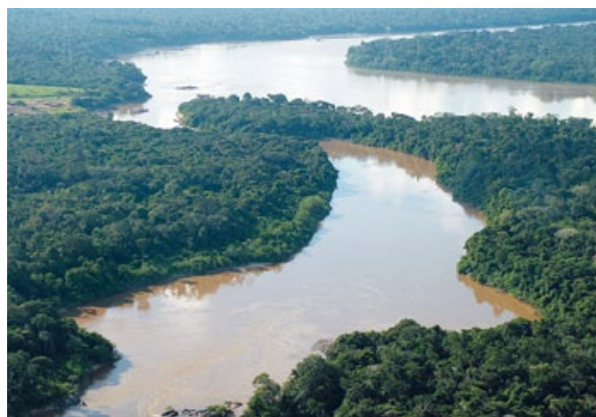
Im Amazonas-Tiefland leben zwischen 5 und 10 Mio. Tierarten

Der Protestmarsch der 2.000 Ureinwohner aus dem bolivianischen Regenwald in die Hauptstadt La Paz hat 69 Tage gedauert. Für ihren Mut und die Ausdauer wurden die Menschen schließlich belohnt: Präsident Morales untersagte den Bau einer Straße durch den Nationalpark Isiboro Sécore. Danach lehnte auch das Parlament das zerstörerische Projekt ab. So konnten die Regenwaldbewohner einen der artenreichsten und außergewöhnlichsten Lebensräume ihres Landes retten – vorerst. „Wir müssen wachsam sein“, schreibt uns die Kampagne für den TIPNIS. „Denn der Straßenbau kann jederzeit wieder aufgenommen werden.“ Rettet den Regenwald hat die Ureinwohner unterstützt: mit zwei Protestaktionen auf der Webseite und der Übergabe von 20.000 Unterschriften an den bolivianischen Botschafter in Berlin. Wir werden auch in Zukunft alles dafür tun, damit der Nationalpark für seine Bewohner erhalten bleibt.