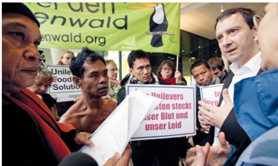
Palmöl zerstört unser Leben: Indonesier protestierten bei Unilever